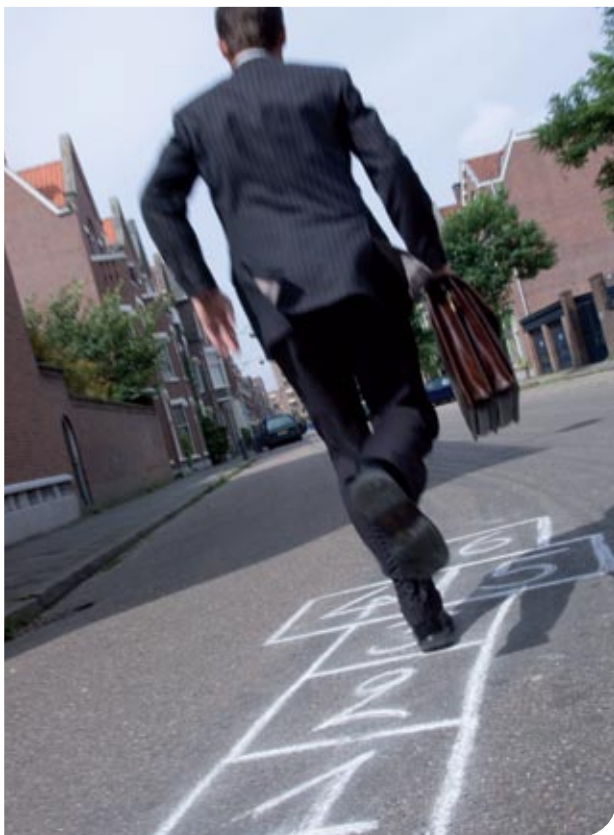
Resultaat in zes eenvoudige stappen

Uw medewerkersonderzoek wordt voor u op maat gemaakt en vlekkeloos uitgevoerd. Dit traject gaat in grote lijnen als volgt in zijn werk: