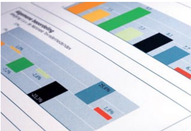
Duidelijkheid in één oogopslag

U ontvangt resultaten op elk gewenst niveau: zo heeft u inzicht in de sterke en zwakke punten per organisatieonderdeel. Uw resultaten worden vergeleken met leidende benchmarks; de Nationale Tevredenheidsindex® of de European Motivation Index®. Ook voor specifieke branches, functies of persoonlijke kenmerken (zoals opleidingsniveau of leeftijd) is volop vergelijkingsmateriaal beschikbaar. U kunt uw uitkomsten hierdoor altijd op waarde schatten.