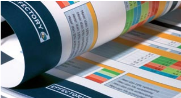
Eenvoudige leesbare rapportages