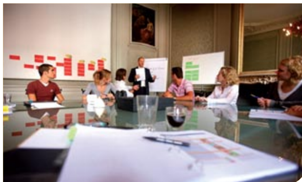
Goede nabespreking en nazorg

aan specifieke personeelsgroepen? Alle vormen zijn mogelijk. U ontvangt tevens goed verzorgde hulpmiddelen voor uw interne communicatie.