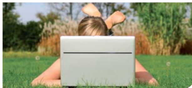
Ook online gemakkelijk in te vullen